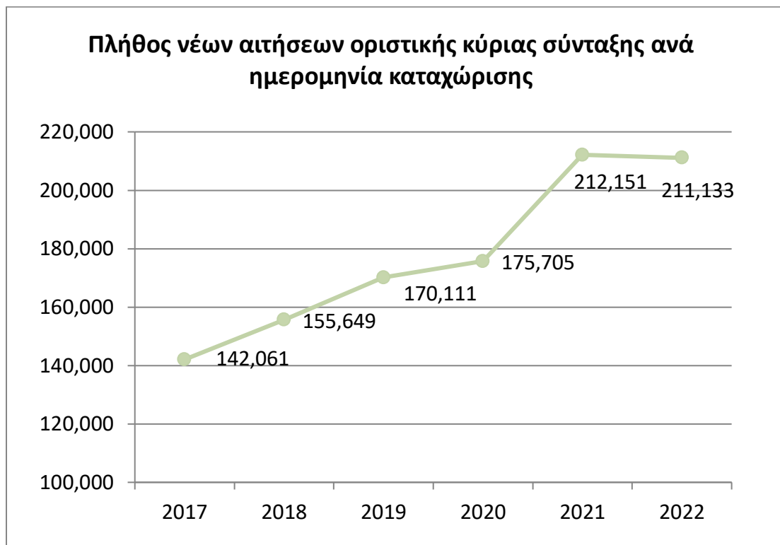
Διάγραμμα 2.1.α: Ετήσια κατανομή νέων αιτήσεων βάσει της ημερομηνίας καταχώρισης.

Στο διάγραμμα που ακολουθεί αποτυπώνεται η τάση των νέων αιτήσεων με βάση την ημερομηνία καταχώρισης.