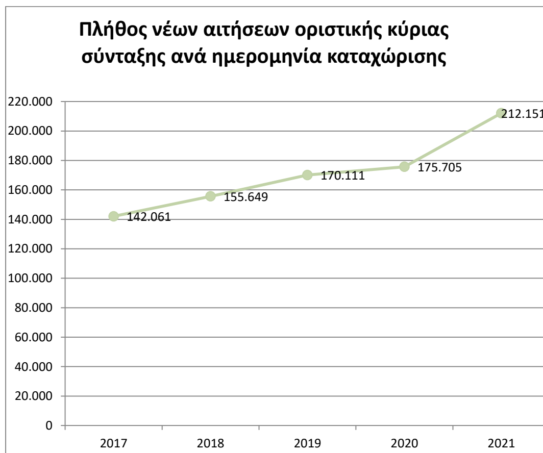
Διάγραμμα 2.1.α: Ετήσια κατανομή νέων αιτήσεων βάσει της ημερομηνίας καταχώρισης.

Στο διάγραμμα που ακολουθεί αποτυπώνεται η τάση των νέων αιτήσεων με βάση την ημερομηνία καταχώρισης.