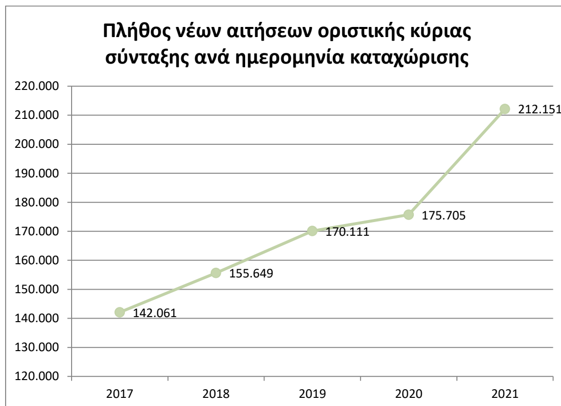
Διάγραμμα 2.1.α: Ετήσια κατανομή νέων αιτήσεων βάσει της ημερομηνίας καταχώρισης.

Στο διάγραμμα που ακολουθεί αποτυπώνεται η τάση των νέων αιτήσεων με βάση την ημερομηνία καταχώρισης, έως τον 12/2021.