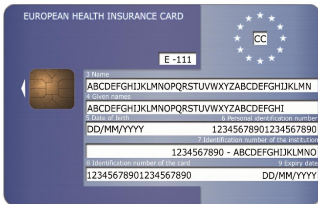
Εικόνα 1: Εμπρόσθια όψη του υποδείγματος