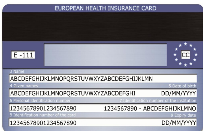
Εικόνα 2: Οπίσθια όψη του υποδείγματος

Παρότι η διάταξη των ορατών στοιχείων είναι ταυτόσημη και στα δύο υποδείγματα, ανεξάρτητα, δηλαδή, από την πλευρά, η οποία χρησιμοποιείται για την ευρωπαϊκή κάρτα ασφάλισης ασθένειας, η εμπρόσθια και η οπίσθια όψη της κάρτας χαρακτηρίζονται από διαφορετική δομή. Η παρουσίαση αυτή συνιστά προϊόν του συμβιβασμού μεταξύ της ανάγκης να υπάρξει ένα ενιαίο υπόδειγμα ευρωπαϊκής κάρτας και των διαρθρωτικών διαφορών των δύο όψεων. Παράλληλα καταβλήθηκαν προσπάθειες, οι δύο όψεις να διαθέτουν ενιαίο ύφος παρουσίασης.