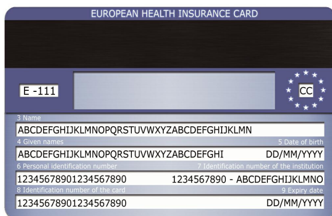
Εικόνα 2: Οπίσθια όψη του υποδείγματος

Παρότι η διάταξη των ορατών στοιχείων είναι ταυτόσημη και στα δύο υποδείγματα, ανεξάρτητα, δηλαδή, από την πλευρά, η οποία χρησιμοποιείται για την ευρωπαϊκή κάρτα ασφάλισης ασθένειας, η εμπρόσθια και η οπίσθια όψη της κάρτας χαρακτηρίζονται από διαφορετική δομή. Η παρουσίαση αυτή συνιστά προϊόν του συμβιβασμού μεταξύ της ανάγκης να υπάρξει ένα ενιαίο υπόδειγμα ευρωπαϊκής