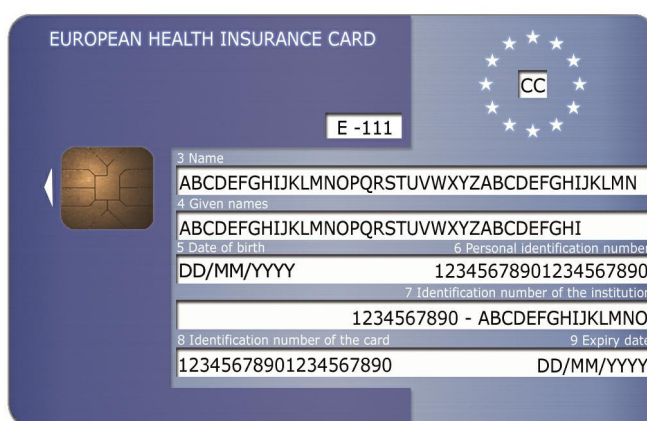
Εικόνα 1: Εμπρόσθια όψη του υποδείγματος

Τα υποδείγματα, τα οποία ακολουθούν, βασίζονται στις τεχνικές προδιαγραφές, οι οποίες ορίζονται στο παρόν έγγραφο και παρατίθενται μόνον εν είδει παραδείγματος.